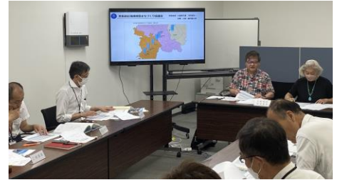
審査委員会の様子

下記のまちづくり活動への助成が決定しました。なお、「はじめの一步助成部門」は、申請がありませんでした。