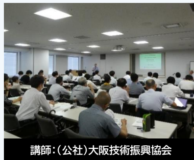
講師：(公社)大阪技術振興協会