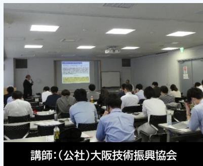
講師：(公社)大阪技術振興協会