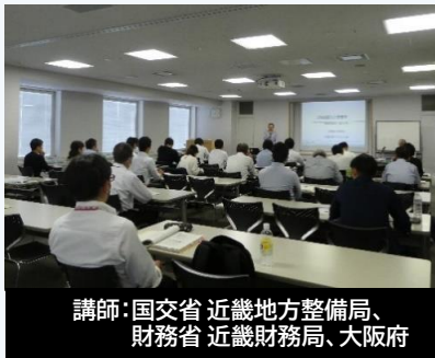
講師：国交省 近畿地方整備局、 財務省 近畿財務局、大阪府