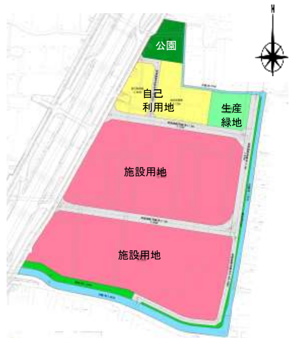
門真市北島東土地区画整理事業土地利用計画図