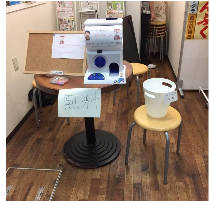
行動経済学の実験