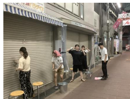
商店街の シャッターの 掃除