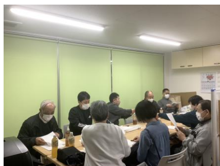
商店街の 会議への出席