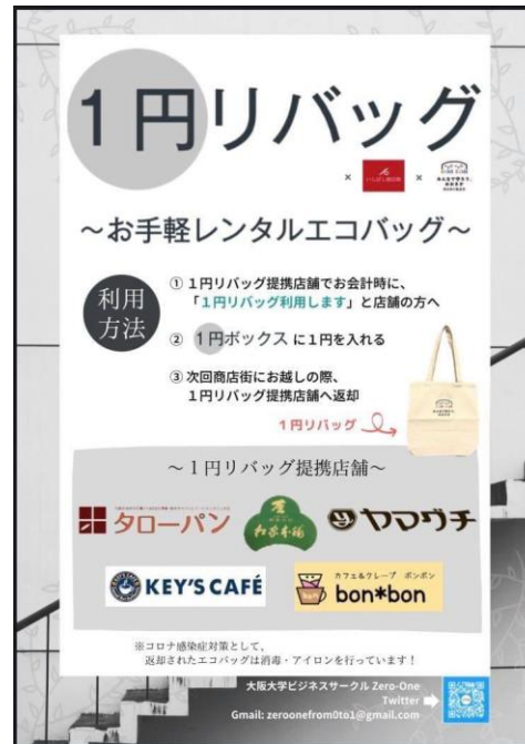
レンタルエコバッグの 実証実験