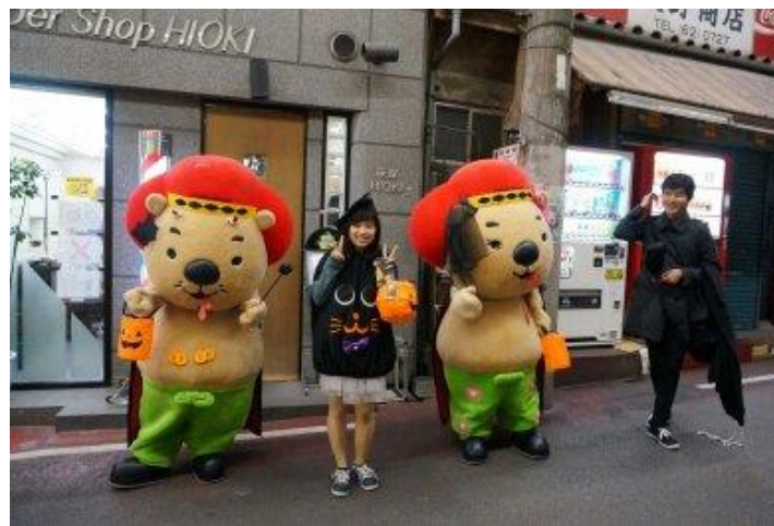
ハロウィンイベント