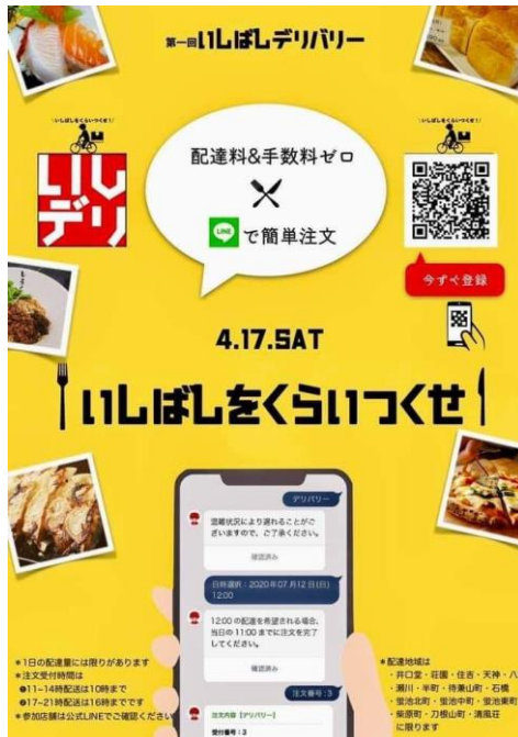
商店街オリジナルの デリバリーシステムの実証実験