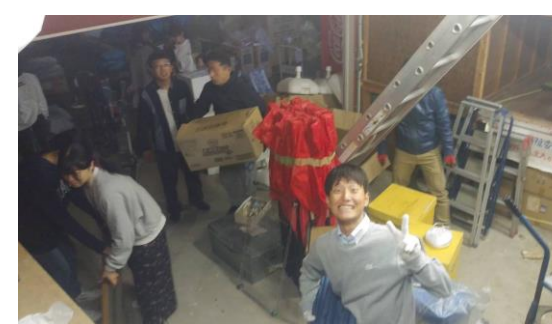
商店街の 倉庫の 掃除