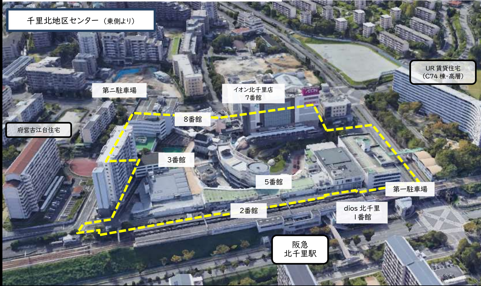
千里北地区センター (東側より)